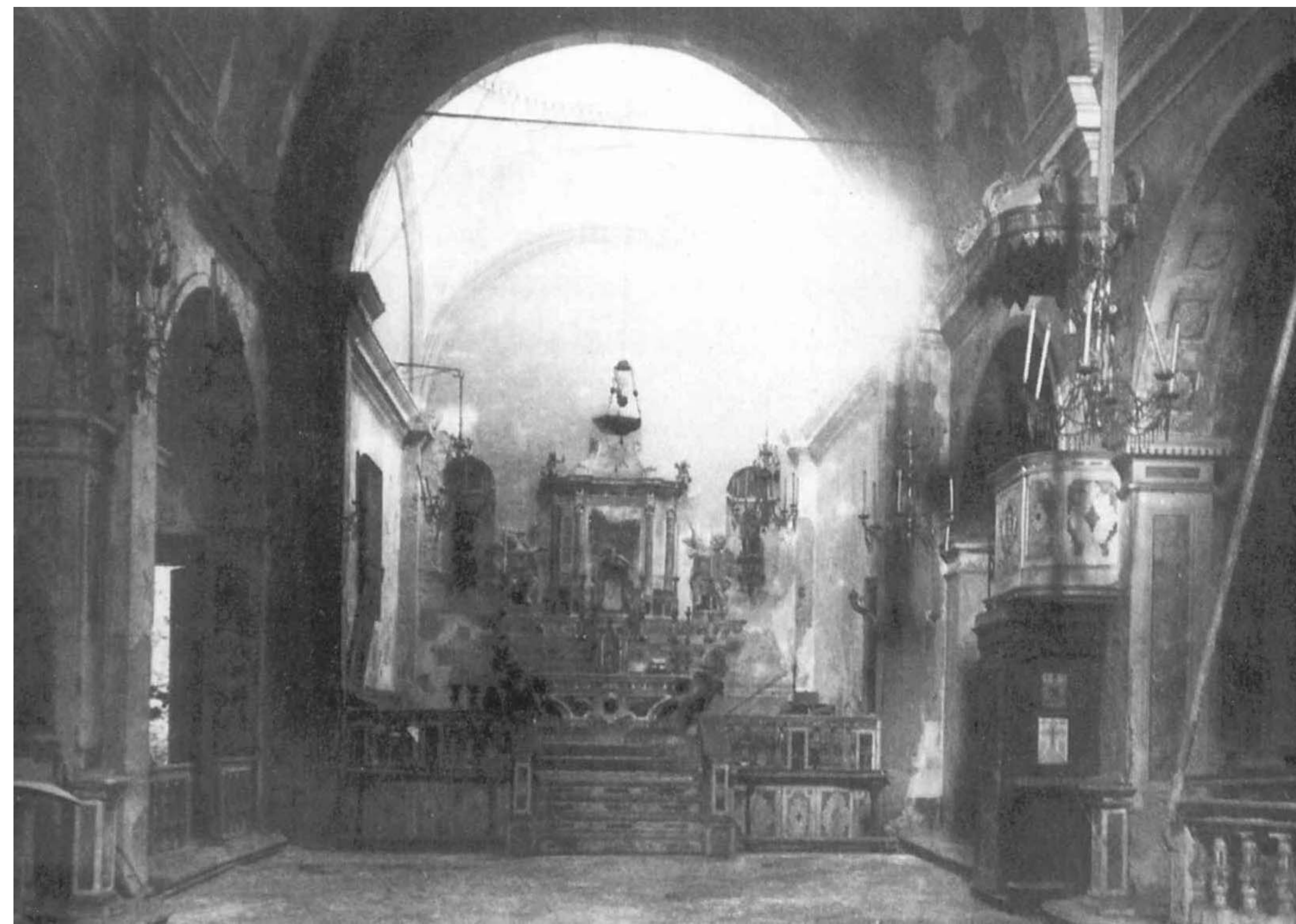
Dopo 1947. La guerra aveva causato al monumento solo minimi danni. / The church before demolition