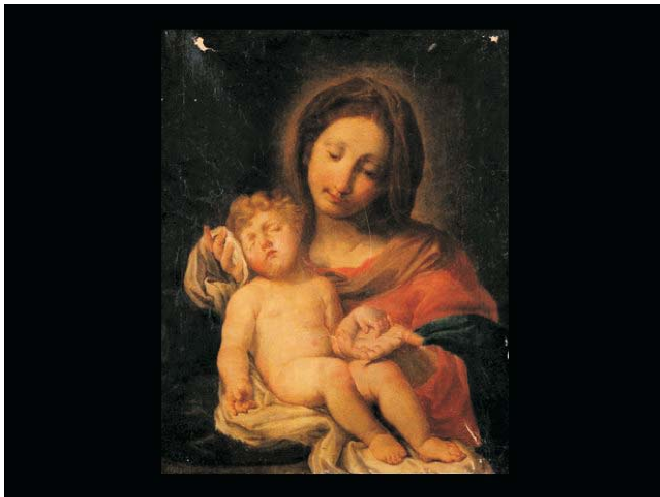
Madonna con Bambino dormiente, olio su tela, XVIII secolo (?), in origine custodita seconda cappella di destra dedicata a Santa Lucia, oggi nella Pinacoteca Nazionale di Cagliari.

The church of Saint Lucia, demolished in 1947, was full of furniture, hundreds of works of art, religious objects and works in marble. Some of these are exhibited in the Museum of St. Eulalia, a short distance from this site, at the National Gallery of Cagliari and other city churches.