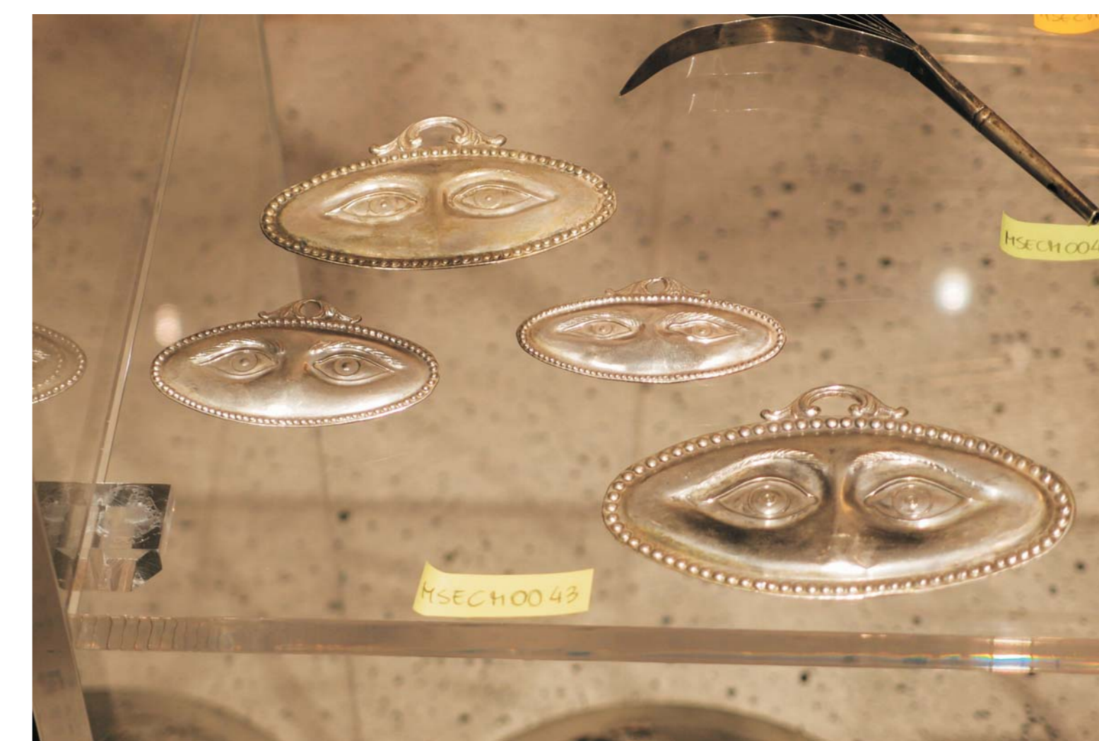
Eyes of Saint Lucia and silver palm of martyrdom. Silver Crown of Saint Lucia in the nineteenth century (Museum of St. Eulalia, a short distance from this site)