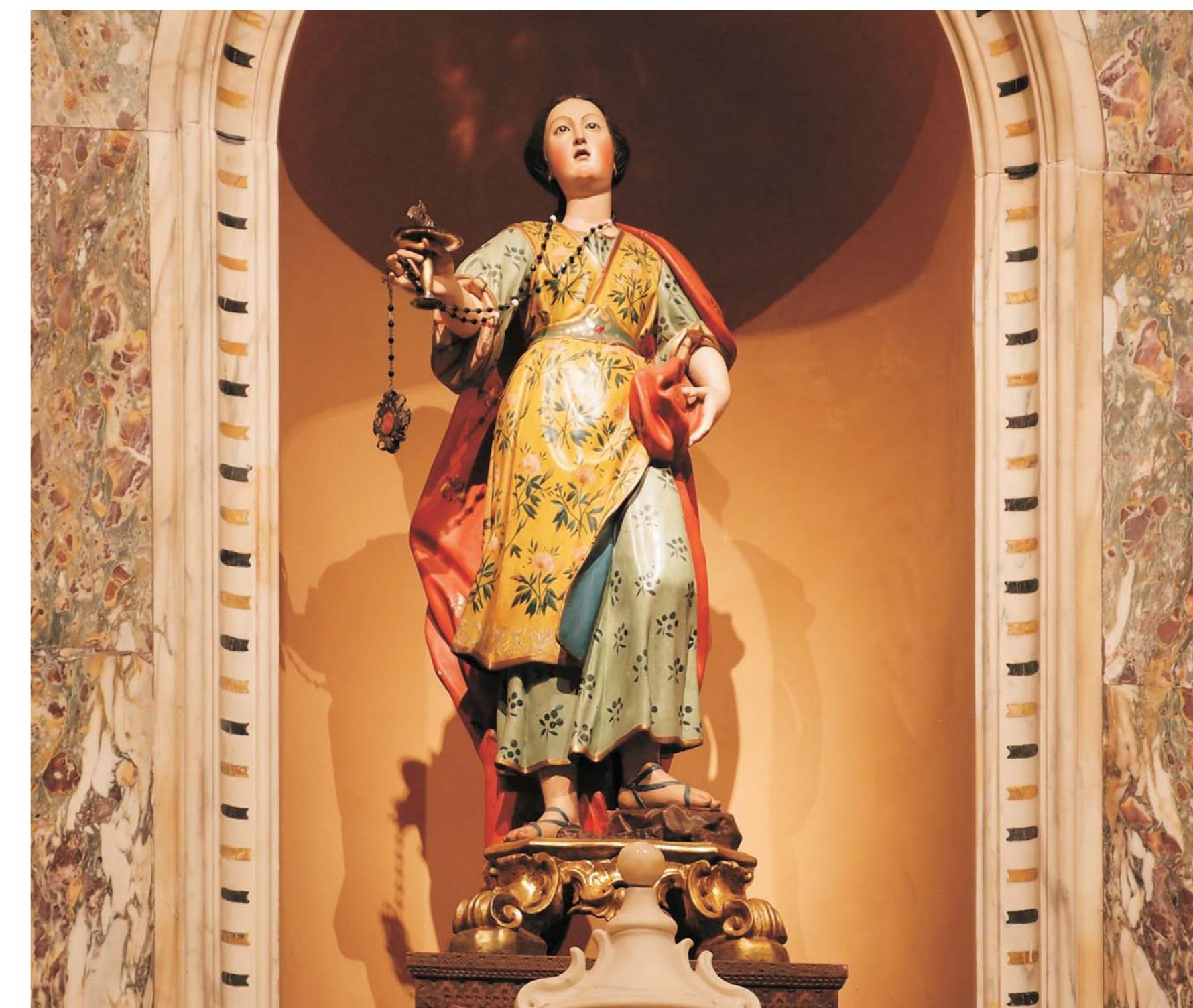
Statua di Santa Lucia nell'altare della seconda cappella di sinistra, attribuita al Lonis (chiesa parrocchiale di Sant'Eulalia)